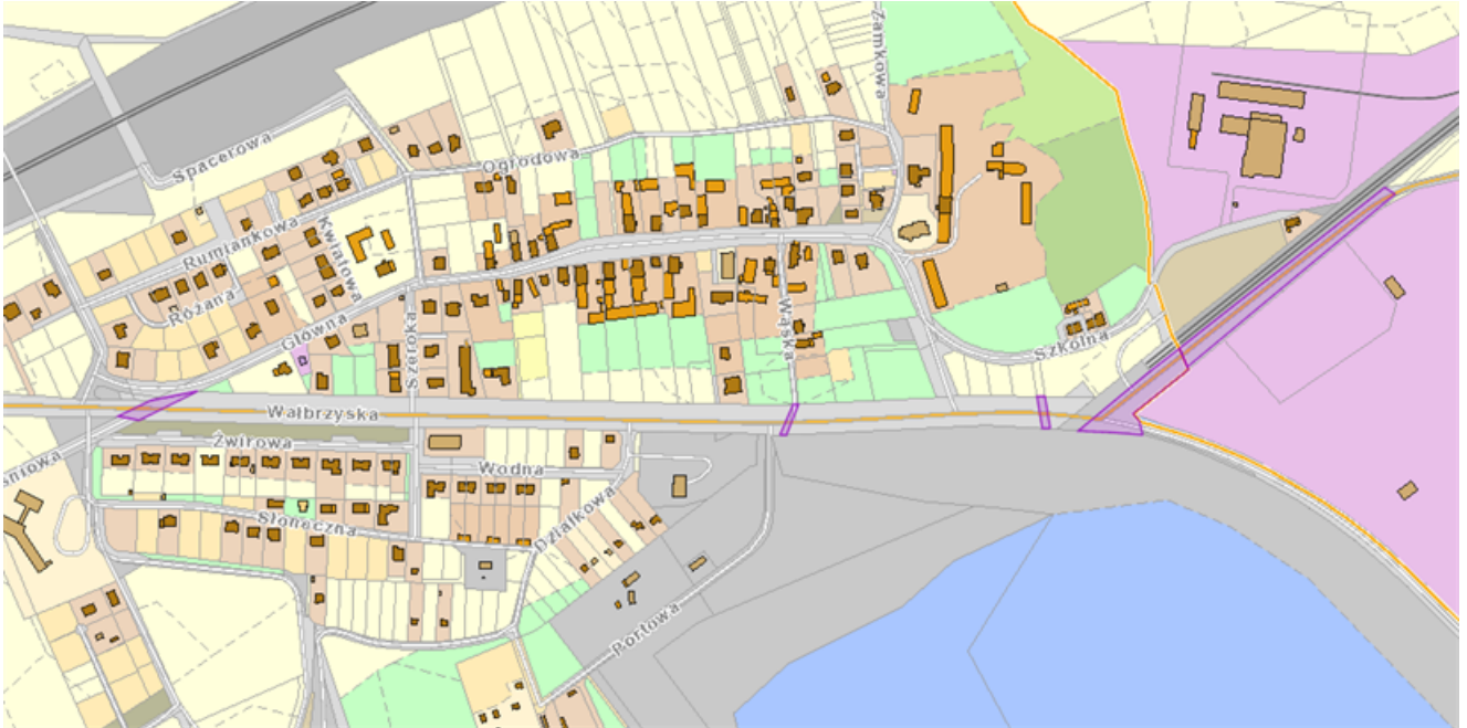
Lokalizacja dz. nr 52 obręb Mietków, gmina Mietków oraz nr 177/2, 202/4, 204/2, 247/2 obręb Borzygniew, gmina Mietków